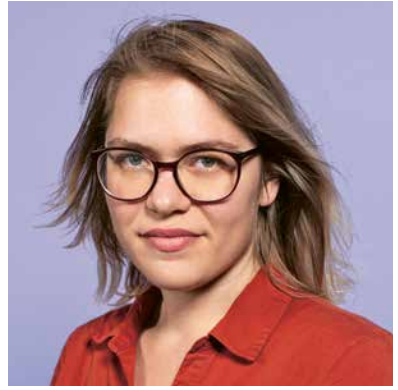
Mise en scène