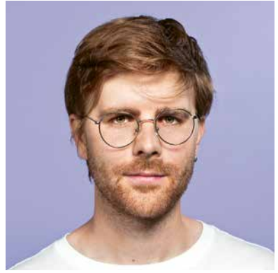
Mise en scène