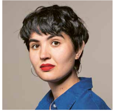
Mise en scène