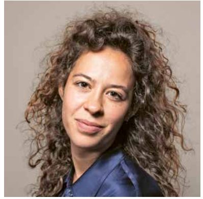
Mise en scène