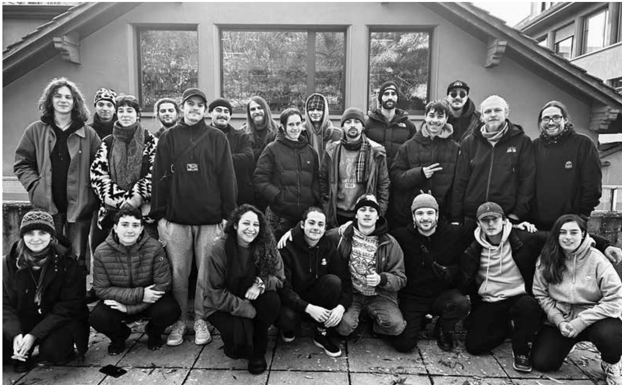
Des élèves de première et deuxième année du CFC de technicien·ne devant La Manufacture, Haute Ecole des arts de la scène de Suisse romande, à Lausanne.

Techniscéniste? La théorie s'apprend à La Manufacture, Haute Ecole des arts de la scène de Suisse romande, qui fête ses 20 ans. Côté pratique, les apprenti·es sont à bonne école au Théâtre de Carouge