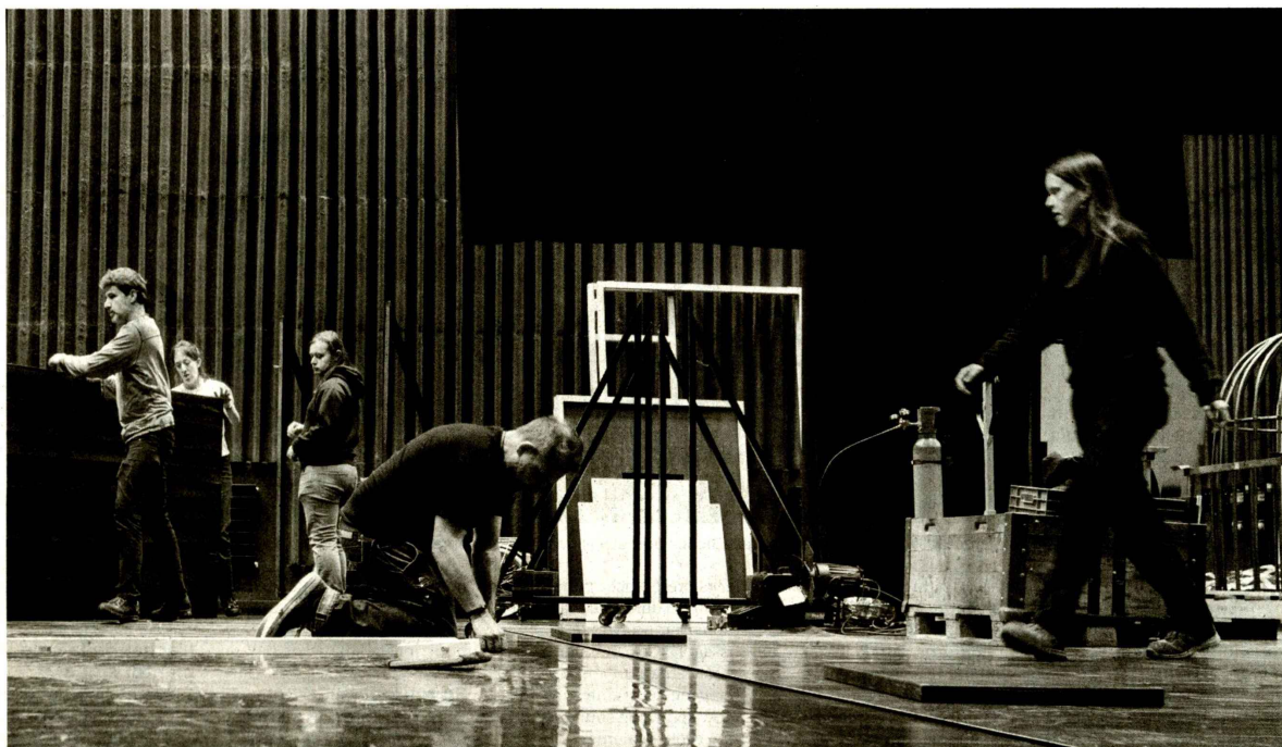
Les techniscénistes s'activent au montage d'un spectacle sur la Grande scène du Théâtre du Jura.

Pas de précipitation donc, mais rien n'empêche de tenter sa chance.