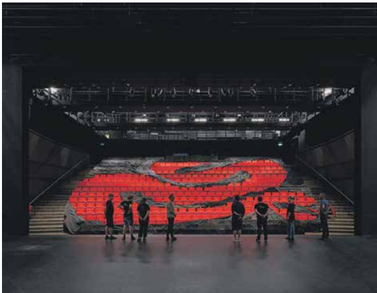
L'équipe technique du Théâtre de Carouge travaille dans un équipement refait à neuf.

«Les différentes régies, plateau, lumière, son et vidéo, doivent être une